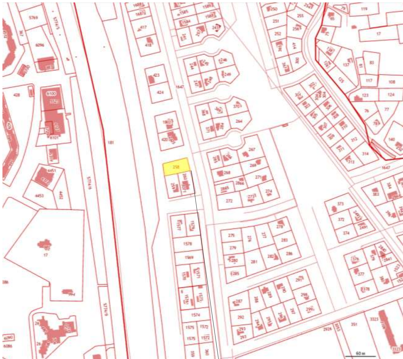
Рассматриваемый земельный участок