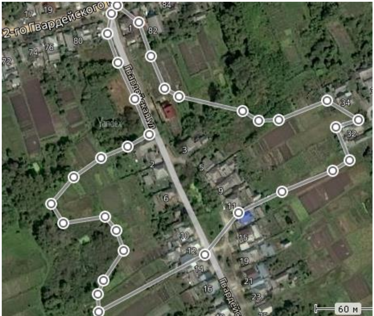
Схема границ ТОС «Территория добрых дел»