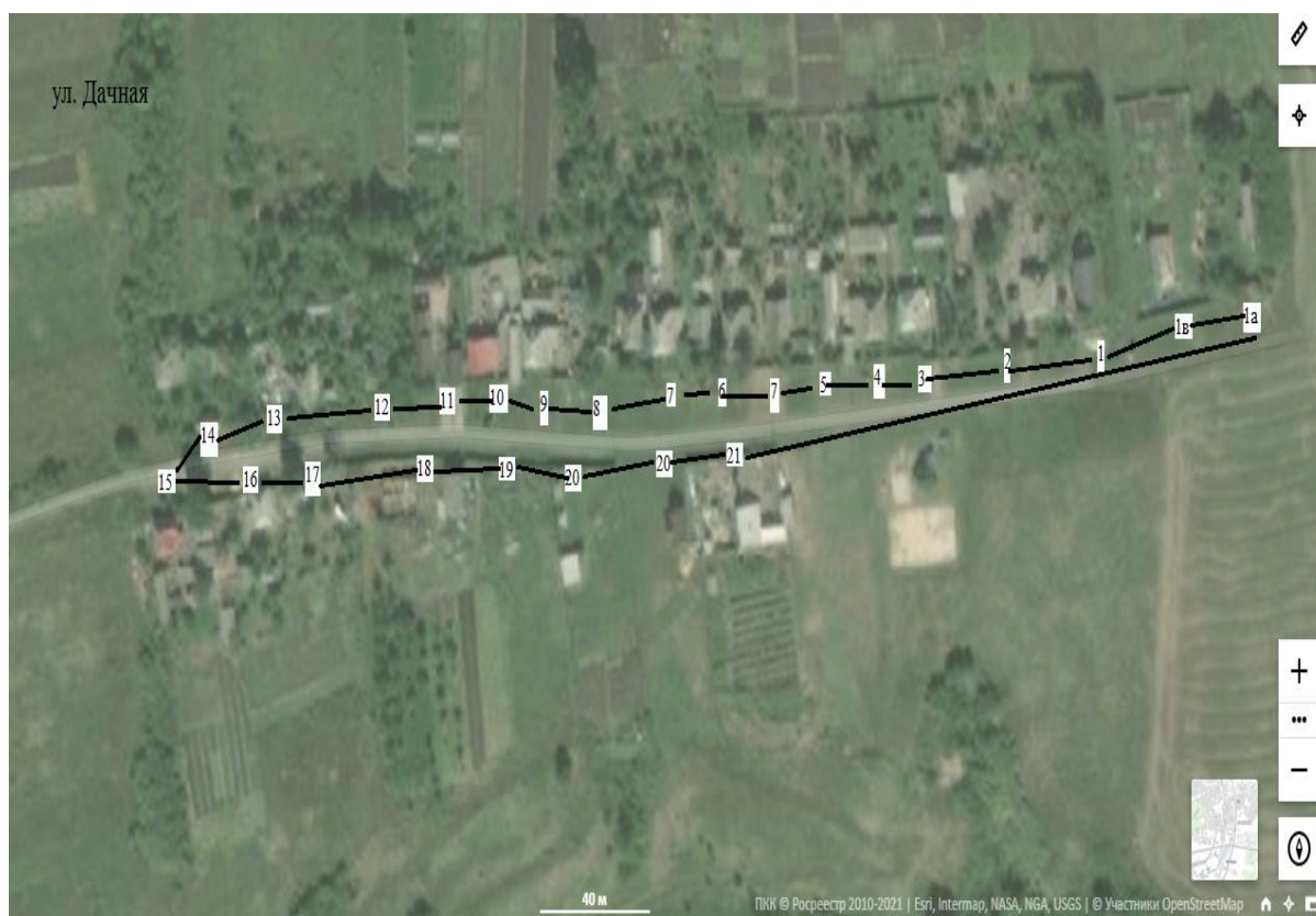
СХЕМА границ ТОС «Дачный»