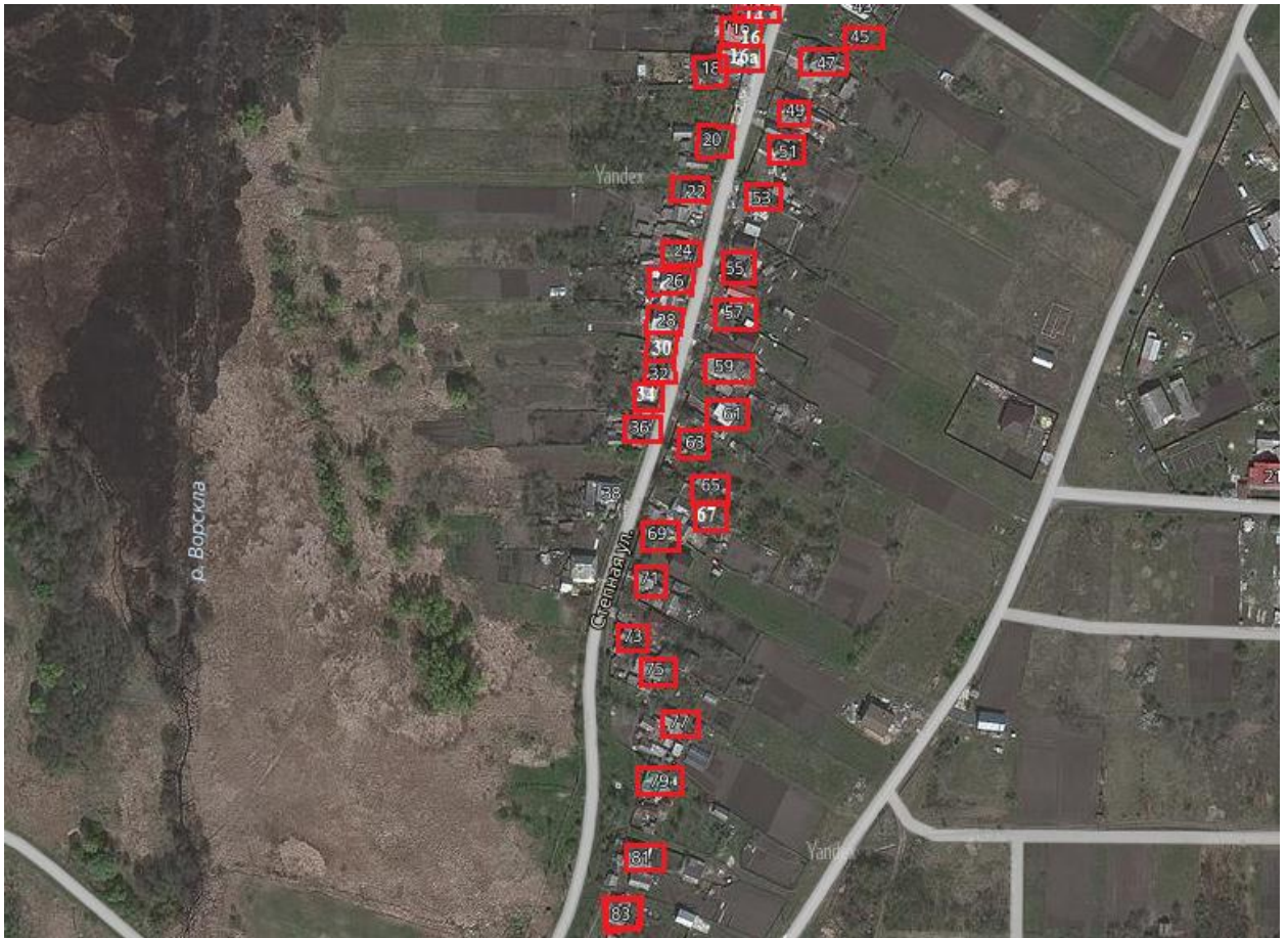
Схема границ ТОС «Солнышко»