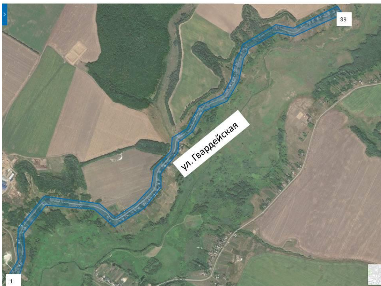
СХЕМА границ ТОС «Гвардейский»