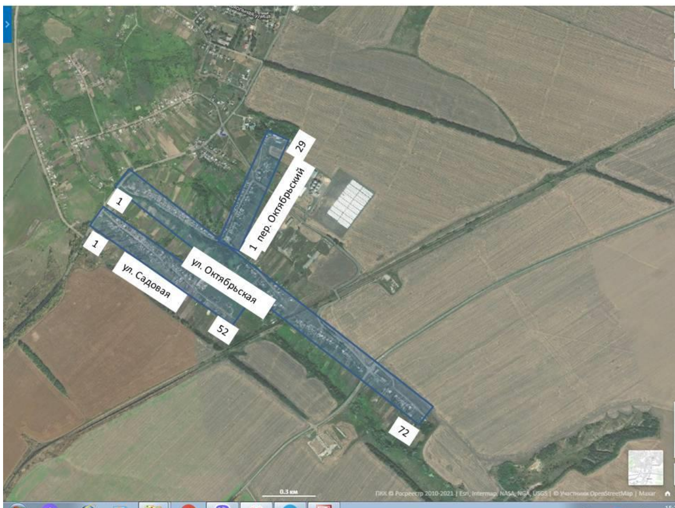
СХЕМА границ ТОС «Карамелька»