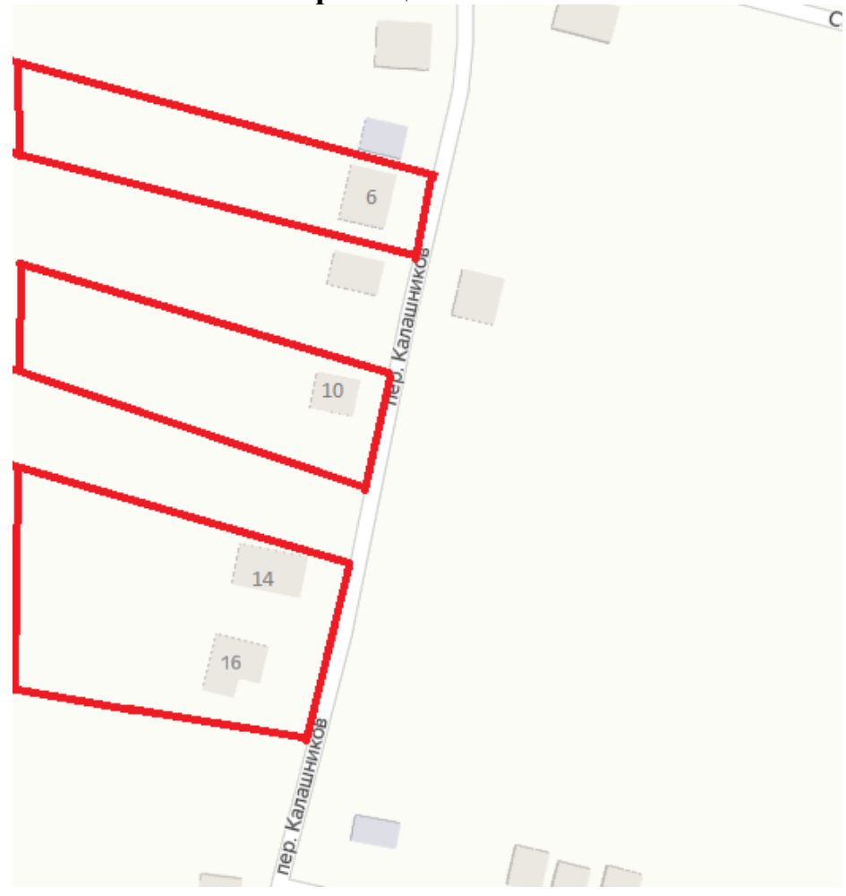
Схема границ ТОС «Казачий»