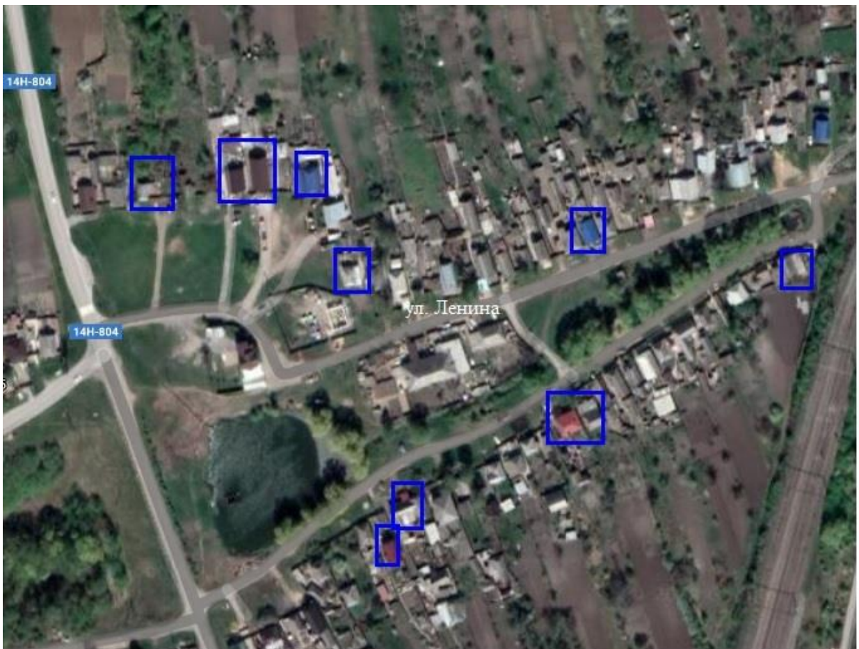
Схема границ ТОС «Ивушка»