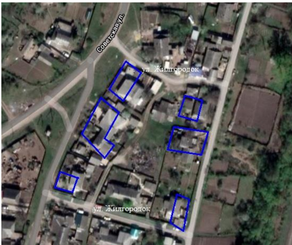
Схема границ ТОС «Надежда»