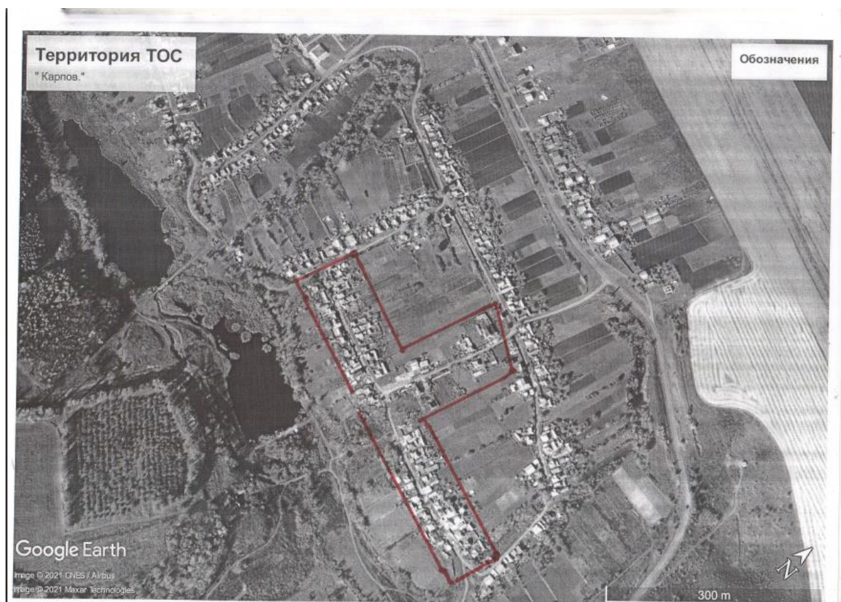
СХЕМА границ ТОС «Карпов»